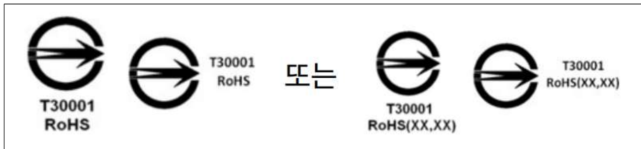
[예시 4] 형식 승인 일괄 검사

* “RoHS”는 제한 물질의 함유 비율이 기준 비율을 초과하지 않음을 나타내며, “RoHS(XX,XX)”는 특정 제한 물질의 함유 비율이 기준 비율을 초과함을 나타냄