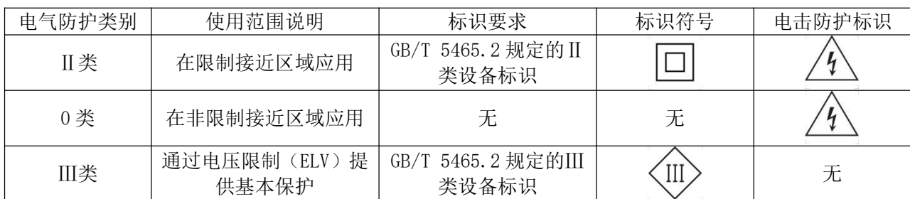
表 1 电气防护类别